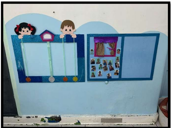
Fotografías de aula, Jardín Infantil Luna.